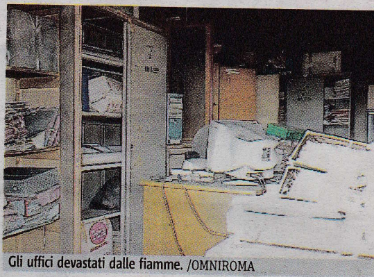
Gli uffici devastati dalle fiamme.

LITORALE Un obiettivo tanto delicato quanto facile da colpire. L'ufficio tecnico del Municipio X è stato dato alle fiamme ieri all'alba, gli autori del rogo hanno abbandonato sul posto stracci intrisi di benzina. Le fiamme hanno distrutto i documenti dell'Unità organizzativa ambiente e litorale (Uoal), compresi i faldoni con le concessioni delle spiagge