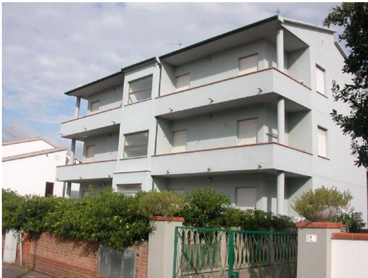
balcone a castello