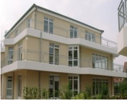
ballatoio a cielo aperto