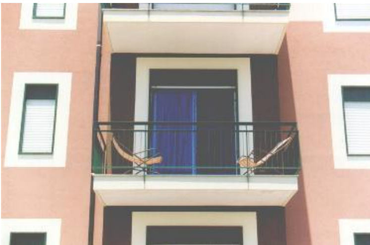
balcone a castello