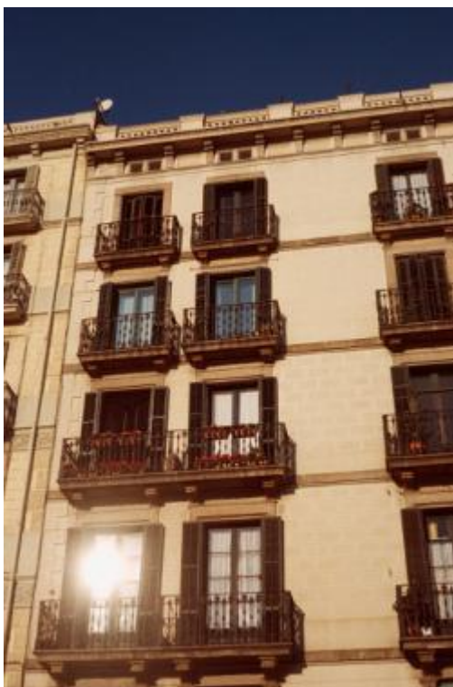
Piccola loggia a filo facciata racchiusa fra due pareti laterali intimamente legata all'unità principale