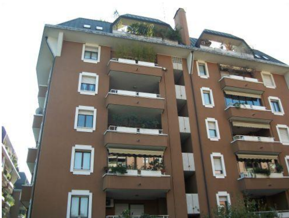
balcone a loggia