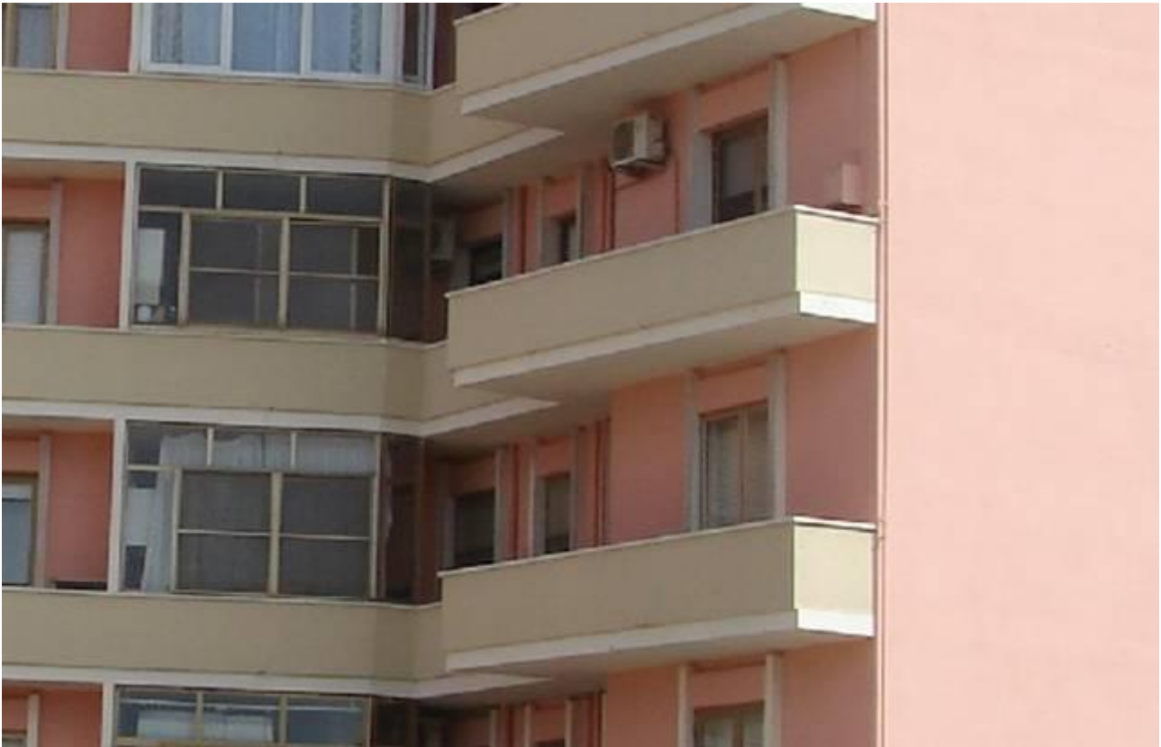
balcone a castello/balcone aggettante